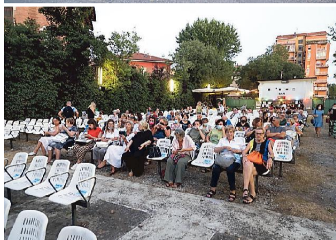
Due momenti della serata di ieri al SuperCinema Estivo